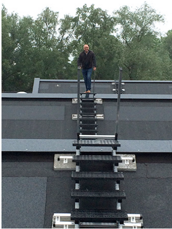
Eine festinstallierte Treppenlandschaft ebnet Kontroll- und Wartungsarbeiten den Weg.