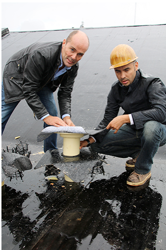
Zweiteiliger Aufbau: Dachgully und Aufstockelement mit Bitumenmanschetten sichern den Anschluss an die Dampfsperre, bzw. Dachabdichtung.