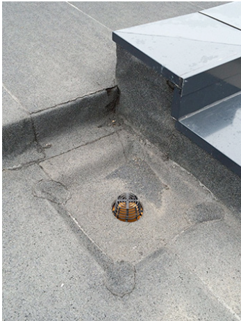
Der Kiesfang schützt den Gully vor Verstopfen des Ablaufkörpers